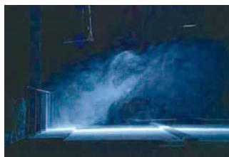
После установки пылезащитной сетки

По всему контуру забора натянута сетка из искусственного пластика с 50% защитным эффектом, сокращающая скорость дующего ветра и предотвращающая перемещение грязи и пыли. На территории размером в 3 раза больше высоты забора установлено ослабление ветра на 70%, на территории размером в 5 раз больше высоты забора установлено ослабление ветра на 50%.