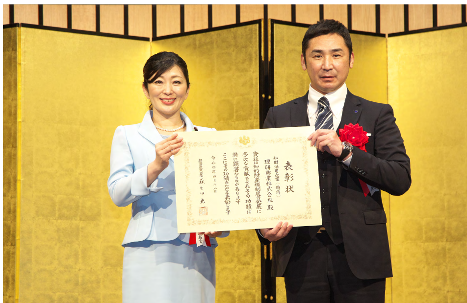
吉川経済産業大臣政務官と記念写真