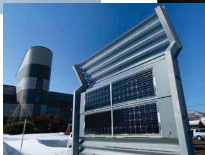
太陽電池付き高性能防雪柵