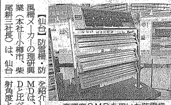
高輝度SMDを用いた防雪柵