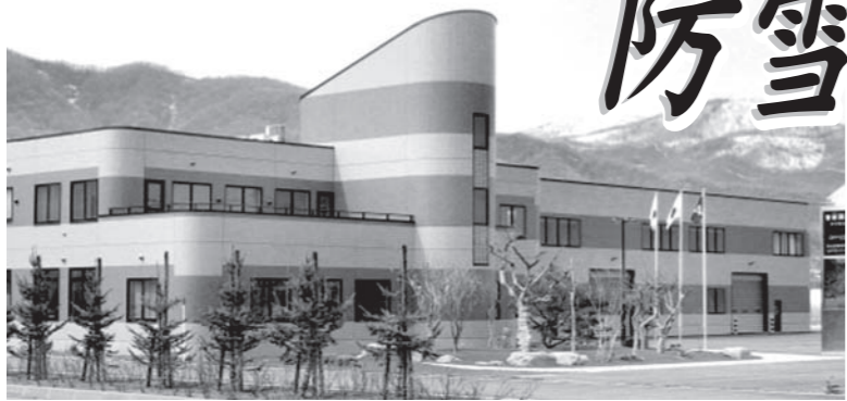
常に新しい発想で製品開発を続ける理研興業の本社社屋