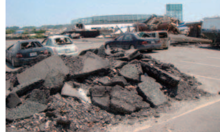
瓦礫積み上げ状況